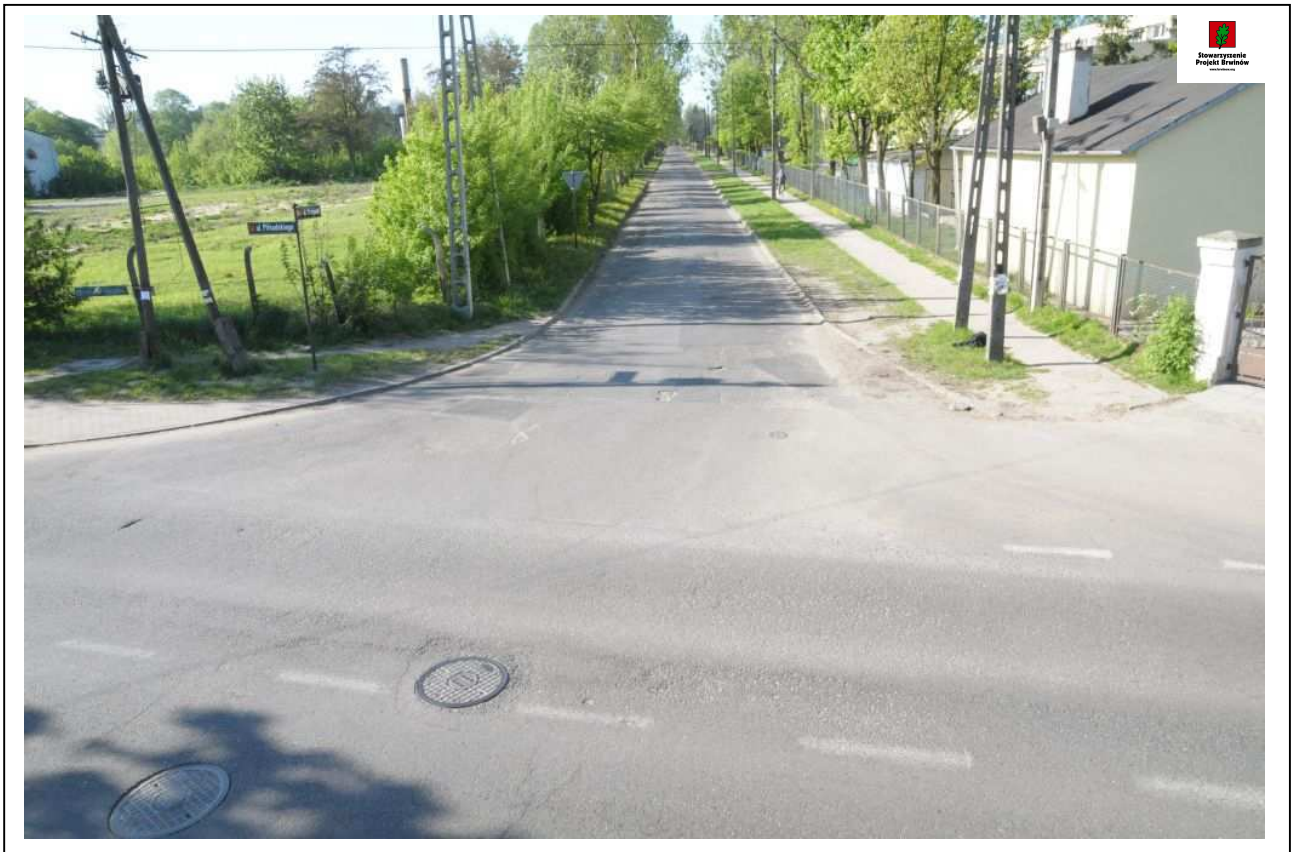
Fot. 5. (8639) Widok skrzyżowania ul. Przejazd z ul. Piłsudskiego. Zdjęcie wykonane z miejsca vis a vis ul. Przejazd.