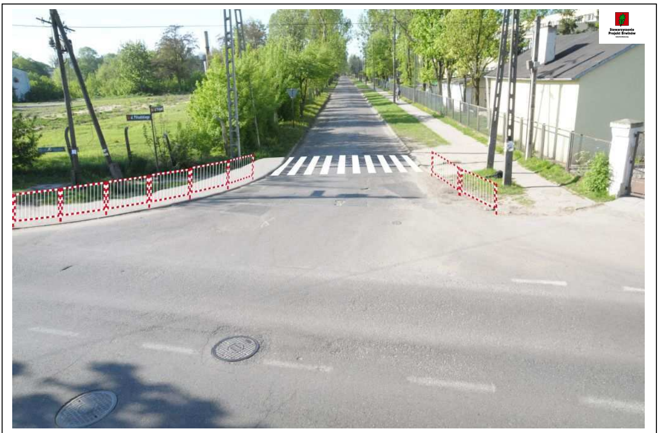
Fot. 6. (8639) Widok skrzyżowania ul. Przejazd z ul. Piłsudskiego. Zdjęcie wykonane z miejsca vis a vis ul. Przejazd. Wrysowano koncepcję budowy chodnika, lokalizacji przejścia dla pieszych oraz montażu ogrodzenia segmentowego.