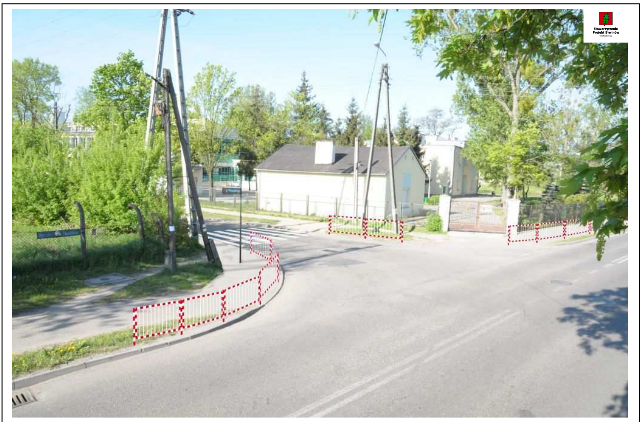
Fot. 8. (8640) Widok skrzyżowania ul. Przejazd z ul. Piłsudskiego. Zdjęcie wykonane od strony skrzyżowania z ul. Chopina. Wrysowano koncepcję budowy chodnika, lokalizacji przejścia dla pieszych oraz montażu ogrodzenia segmentowego.