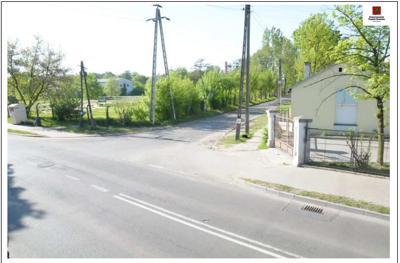
Fot. 9. (8647) Widok skrzyżowania ul. Przejazd z ul. Piłsudskiego. Zdjęcie wykonane od strony skrzyżowania z ul. Szkolną.