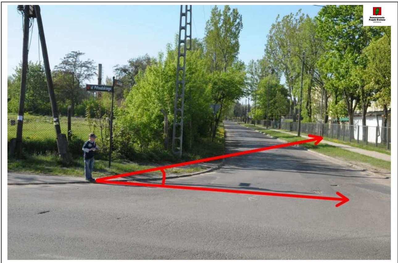
Fot. 4. (8717) Zdjęcie dziecka przed "prześciem" przez jezdnię ul. Przejazd w rejonie ul. Piłsudskiego - wrysowano strzałki kierunku przejścia oraz widoczności. Zwracamy uwagę na bardzo słabą widoczność z końca chodnika przed jezdnią ul. Przejazd. W zasadzie pieszy może zobaczyć nadjeżdżające pojazdy dopiero po wejściu na jezdnię.