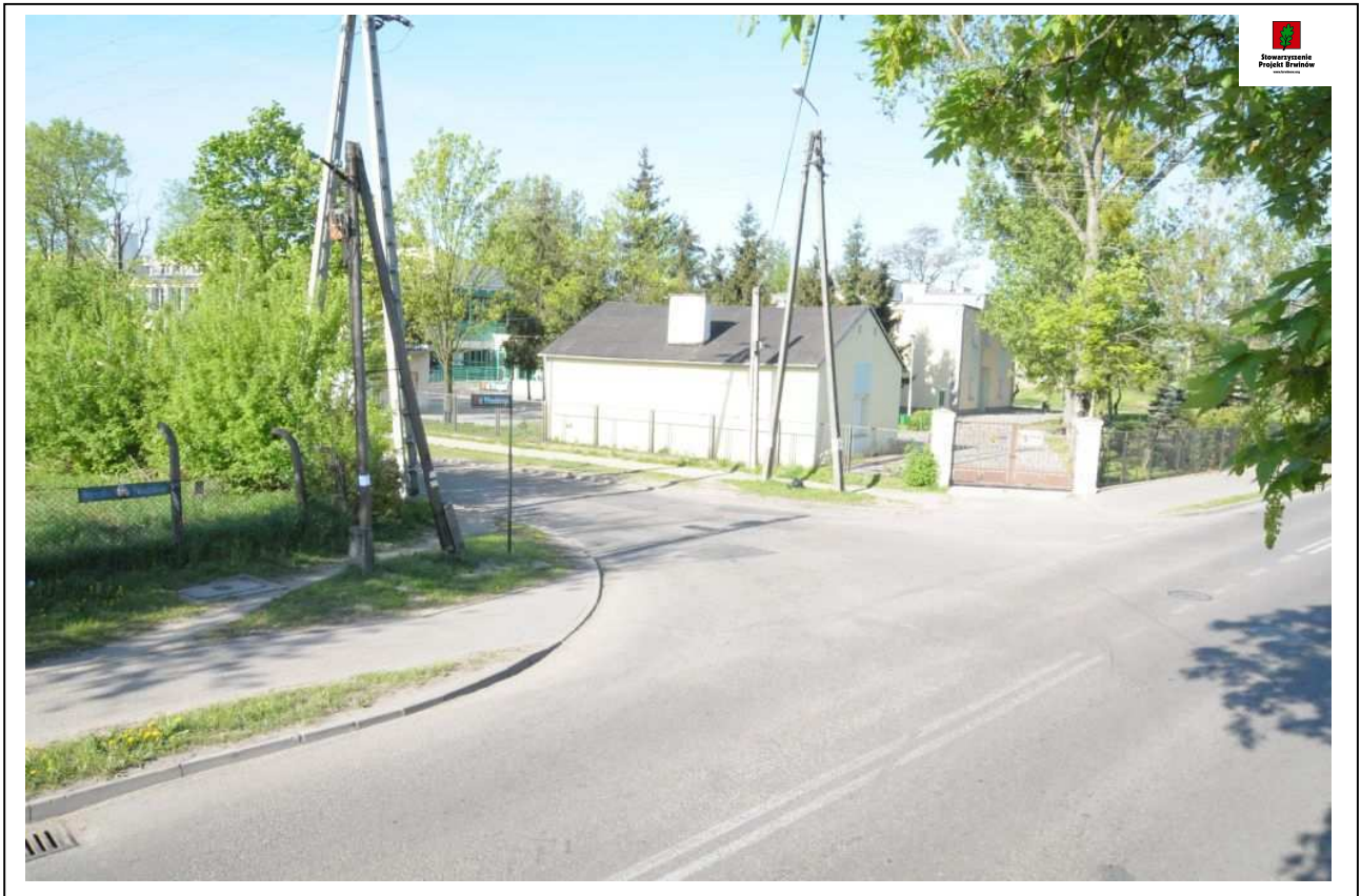
Fot. 7. (8640) Widok skrzyżowania ul. Przejazd z ul. Piłsudskiego (w tle widać budynki Zespołu Szkół nr 1 przy ul. Piłsudskiego 11). Zdjęcie wykonane od strony skrzyżowania z ul. Chopina.