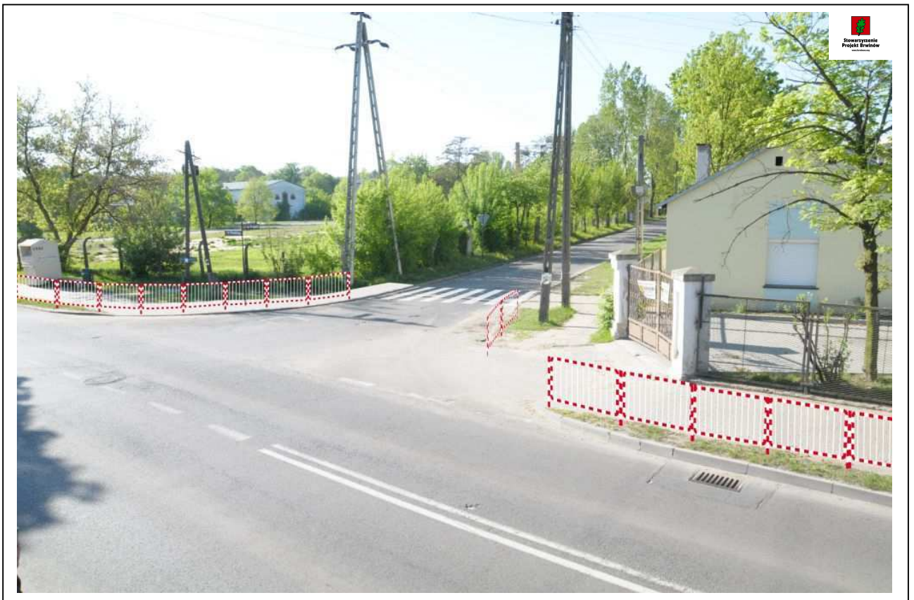
Fot. 10. (8647) Widok skrzyżowania ul. Przejazd z ul. Piłsudskiego. Zdjęcie wykonane od strony skrzyżowania z ul. Szkolną. Wrysowano koncepcję budowy chodnika, lokalizacji przejścia dla pieszych oraz montażu ogrodzenia segmentowego.