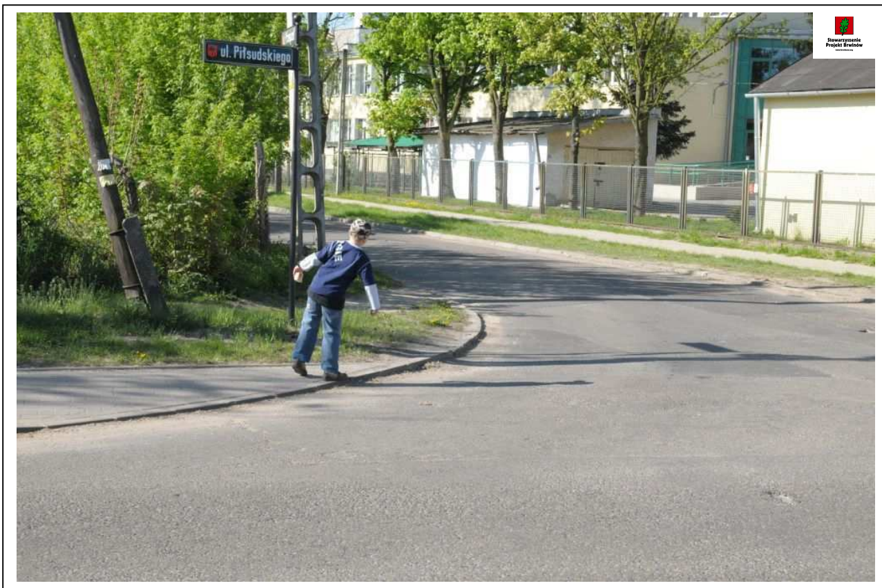
Fot. 1. (8714) Zdjęcie dziecka przed "prześciem" przez jezdnię ul. Przejazd w rejonie ul. Piłsudskiego (w tle widać budynki Zespołu Szkół nr 1 przy ul. Piłsudskiego 11). Zwracamy uwagę na bardzo słabą widoczność z końca chodnika przed jezdnią ul. Przejazd. W zasadzie pieszy może zobaczyć nadjeżdżające pojazdy dopiero po wejściu na jezdnię.